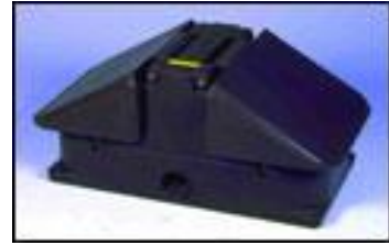
Abb. 1: Frostsichere Tränke ohne Stromanschluss

Die Tränken sind nach Möglichkeit in der Nähe des Außenzaunes zu platzieren – dadurch wird die Befüllung, Reinigung und Kontrolle erleichtert. Das Fassungsvermögen der Trogtränke richtet sich nach der Tierzahl. Bei Tränkebecken sollte die Durchflussrate für Mastschweine mindestens 0,7 Liter/Minute betragen, für Absetzferkel mind. 0,5 l/min. Die Tröge sind regelmäßig zu reinigen (dabei ist ein Abfluss von Vorteil), da die Schweine verschmutztes Wasser nicht gerne aufnehmen. Infolge dessen fressen die Schweine weniger, was meist zu niedrigeren Tageszunahmen führt.