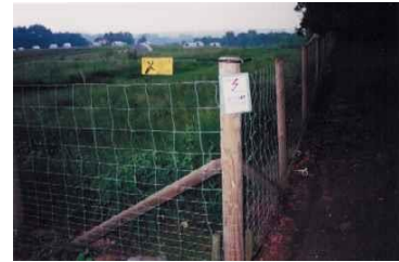
Abb. 5: Außenzaun: unten engmaschig, 1,5 m hoch

Allgemein wird eine doppelte Umzäunung eines Schweine-Freilandgeheges gefordert. Der äußere Zaun muss dabei mindestens 1,5 m hoch und in der unteren Hälfte engmaschig ausgeführt sein. Um zu verhindern, dass der Zaun von Wildschweinen untergraben wird, verlangt die Veterinärbehörde, den Zaun 20 - 50 cm tief in den Boden einzugraben. Die Tore des äußeren Zaunes müssen gekennzeichnet und verschließbar sein. Der innere Zaun wird als Litzenzaun mit drei stromführenden Bändern/Litzen in ca. 15, 30 und 40 cm Höhe ausgeführt. Der Abstand zwischen Außen- und Innenzaun sollte mindestens 50 cm betragen. Nach Schneefall müssen die Litzen vom Schnee befreit werden, um die Funktionstüchtigkeit zu gewährleisten.