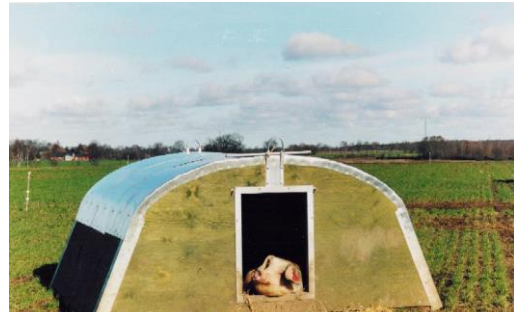
Abb. 2: Empfohlen werden Hütten aus Holz, die entweder selbst angefertigt oder zugekauft werden.

Schweine unterscheiden zwischen Tages- und Nachtruhestätten. Wildschweine suchen während der Nachtruhe geschützte Plätze auf an denen sie Mulden ausheben, die sie mit Dämmmaterial (Zweige, Gras, Blätter etc.) auslegen und die groß genug sind, um allen Rottemitgliedern Platz zu bieten. In der Freilandhaltung von Hausschweinen übernehmen Hütten die Funktion dieser Nachtruhestätten. Sie sollen Schutz vor Witterung bieten und artgemäßes Ruhen ermöglichen.