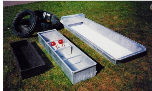
Abb. 3: Von rechts: Suhle (500 l) und 2 Varianten von Trogränken

Schweine haben keine Schweißdrüsen – das heißt, sie können nicht schwitzen! Zusätzlich erschwert ihnen die Speckschicht die Wärmeabgabe in den warmen Jahreszeiten. Für eine funktionierende Wärmeregulation sind sie daher ab Temperaturen von +18 °C auf den Kühleffekt der Suhlen angewiesen. Wird auf Suhlen und schattenbietende Einrichtungen verzichtet, kann es bei den Tieren an heißen Tagen zu einem drastischen Anstieg der Körpertemperatur kommen, bis hin zum Verenden durch Hitzschlag.