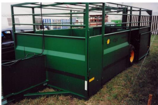
Abb. 6: Hydraulisch absenkbarer Transportwagen

Um das Abtransportieren der Schweine für Tier und Mensch so stressfrei wie möglich gestalten zu können, ist eine zweckmäßige Einrichtung erforderlich. Denkbar ist ein spezieller Wagen (wenn möglich auf Bodenniveau absenkbar), der schon einige Zeit vorher im Gehege aufgestellt werden kann und auf den die Tiere mit Futter gelockt werden. Die Schweine können aber auch in der Hütte oder durch einen festen Zaun vor der Hütte gepfercht werden und von dort mittels einer rutschfesten Rampe direkt auf den Transporter geladen werden.